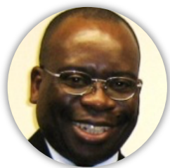
Ndugumbo Vita Université Laval