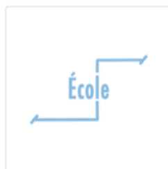
Participation dans l'école