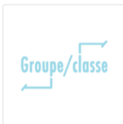
Participation dans le groupe ou la classe

L'International Society for Cultural-historical and Activity Research (ISCAR) se voue au développement de la théorie de l'activité dont est issu l' insight fondamental suivant: participer c'est apprendre , qu'il s'agisse d'apprendre un langage, des façons de penser, de se conduire ou de contribuer. Alors qu'au Québec, les acteurs de l'éducation se tournent vers la recherche pour informer leurs prises de décisions au bénéfice de la réussite éducative, la théorie sociale de l'apprentissage s'applique dans les quatre arènes retenues par le réseau PÉRISCOPE à des fins d'intervention et de recherche, soit les suivantes: