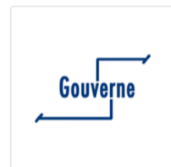
Participation à la gouverne