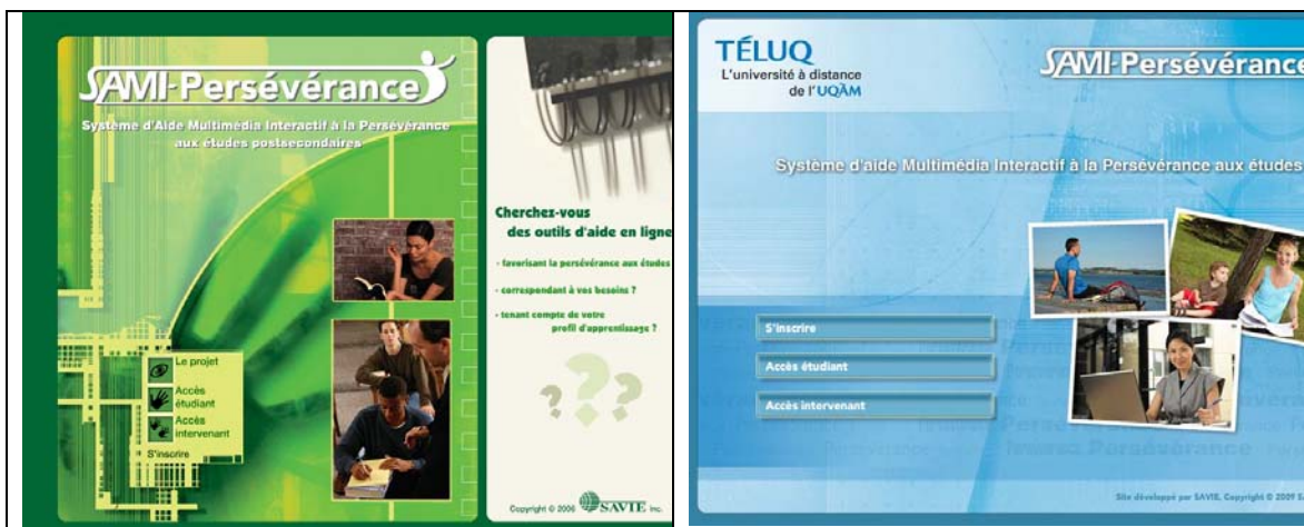
Figure 1 : L'adaptation de la page d'accueil

La figure 2 présente la démarche de recherche à l'aide d'une carte conceptuelle. Chacun de ces titres ouvre à l'ensemble des outils d'aide qu'il regroupe.