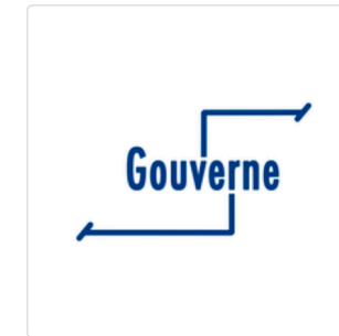
Participation à la gouverne