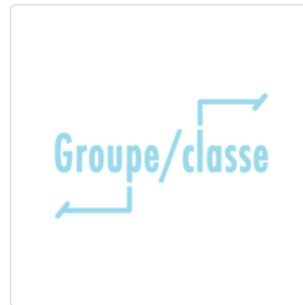
Participation dans le groupe ou la classe